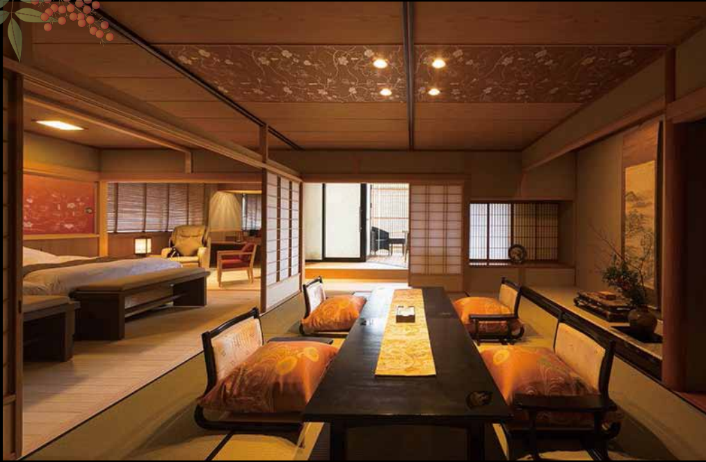
展望露天風呂付 Premium 和洋室 【群青】